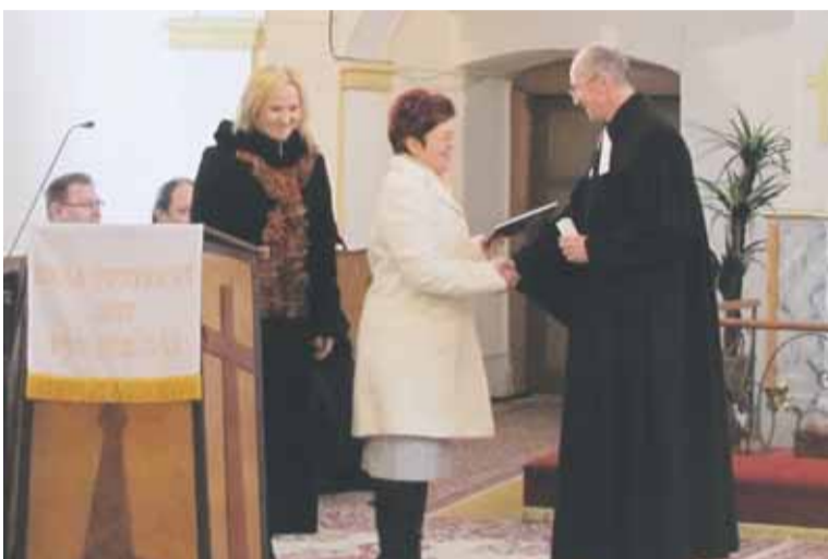
Na slávnostných službách Božích predstavili knihu o dejinách cirkevného zboru v Poprade-Veľkej.