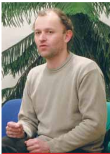
Autor P. Zaťko v knihe popisuje úskalia života medzi bezdomovcami, ktorými sám prešiel.

Vyšla kniha, ktorá realisticky vykresľuje, čím všetkým musí človek na ulici prejsť, aby si zabezpečil nevyhnutné životné potreby. Autor v knihe priznal svoj pocit hanby a beznádeje. Na druhej strane sa snaží nájsť pozitívum vo všetkých aspektoch neľahkého života. Tak ukazuje čitateľom, aká je tenká hranica medzi usporiadaným a neusporiadaným životom.