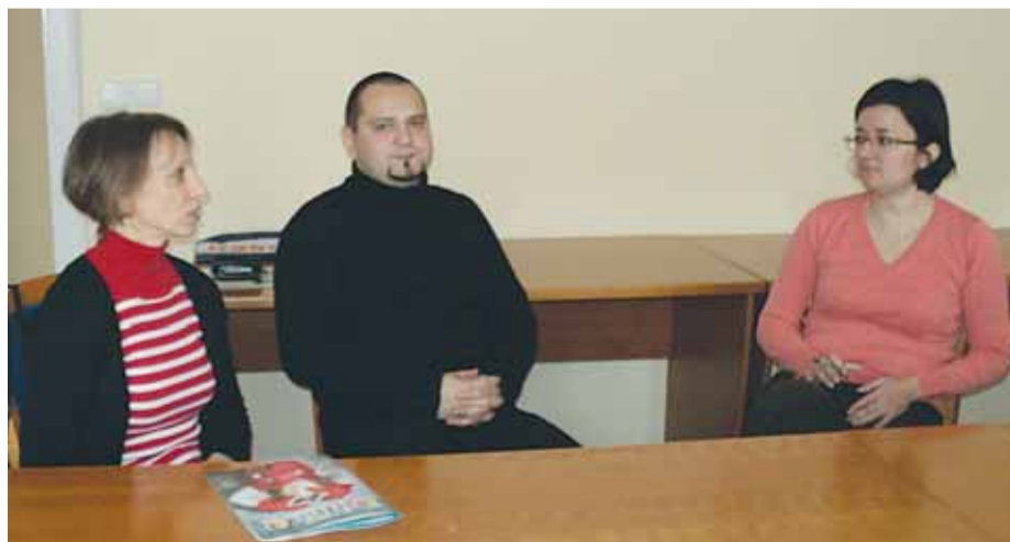
Zástupcovia tímu Grundtvig diskutovali na GBÚ aj o ďalších návrhoch na pokračovanie projektu Trvalo sa učiace partnerstvá v našej cirkvi.